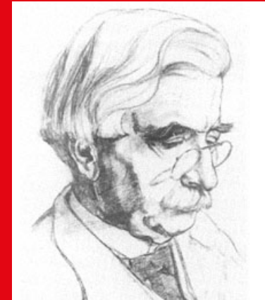
Gerardus Horreüs de Haas

Keklik Yücel Voormalig Tweede Kamerlid PvdA / Bestuurskundige Deventer, 1 mei 2020