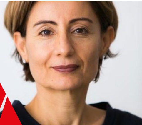
Keklik Yücel Voormalig Tweede Kamerlid PvdA / Bestuurskundige