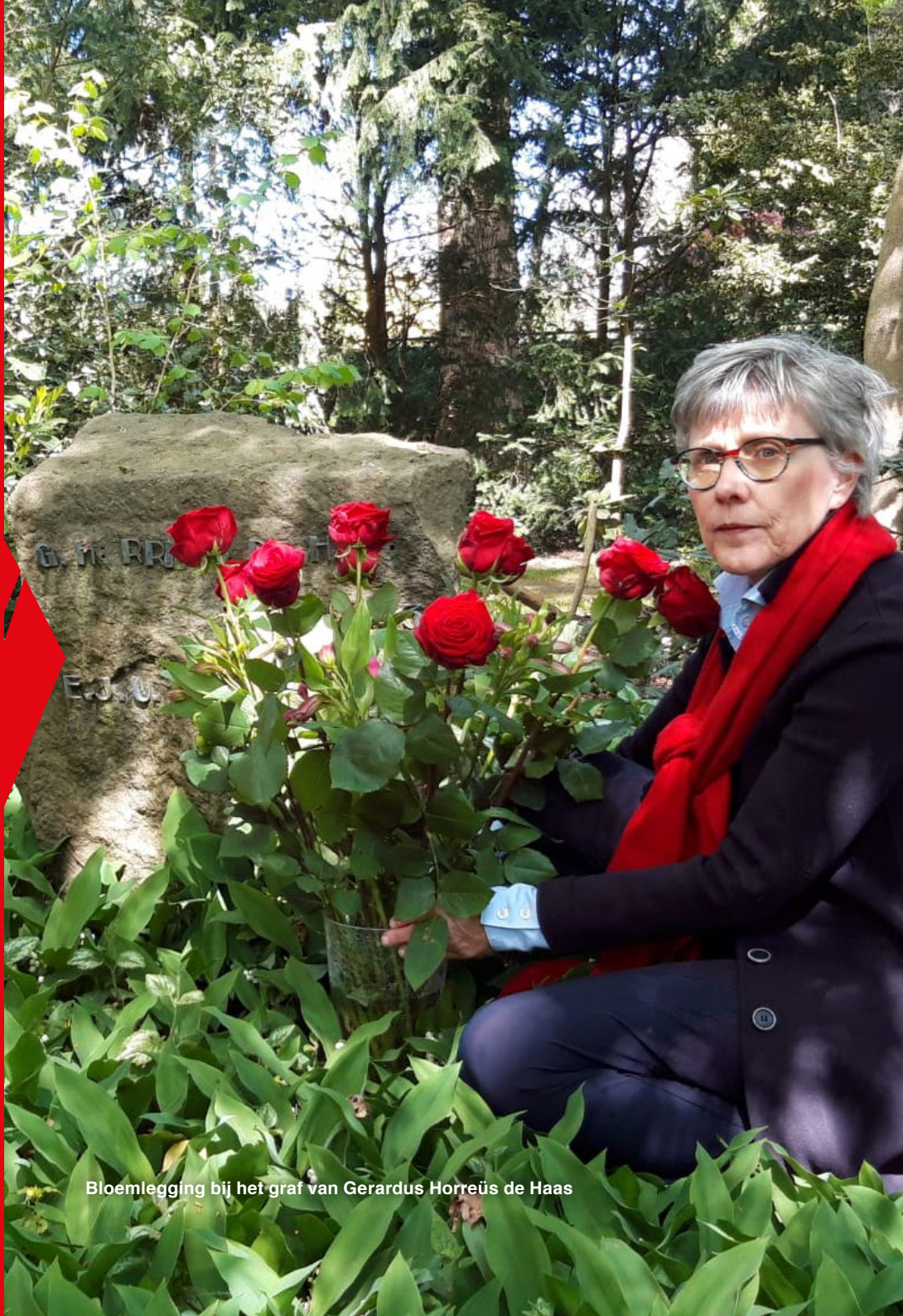
Bloemlegging bij het graf van Gerardus Horreüs de Haas